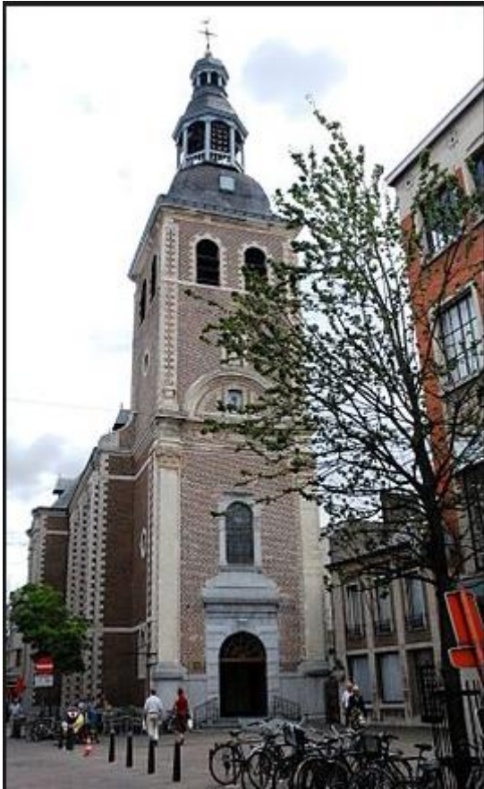
Sint-Quintinuskathedraal in centrum Hasselt